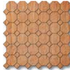
TF4MS Ottagona Rosato (A) PCS/090