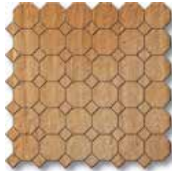
TF2MS Ottagona Ocra (A) PCS/090