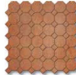
TF5MS Ottagona Rosso (A) PCS/090