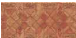
C000066 Fascia Scura PCS/081