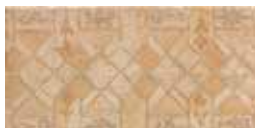
C000065 Fascia Chiara PCS/081