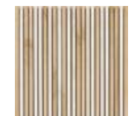
SP59MS Mosaico Mix Agata-Alabastro (B)