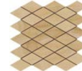
Mosaico Rombi Agata Miele (A)