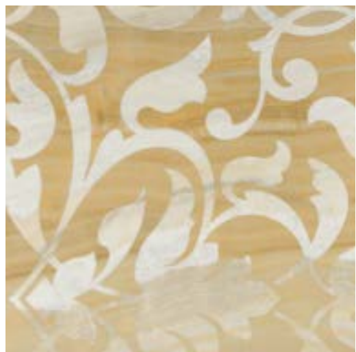
Broccato Agata-Alabastro 60x60 - 24"x24" 6 soggetti assortiti