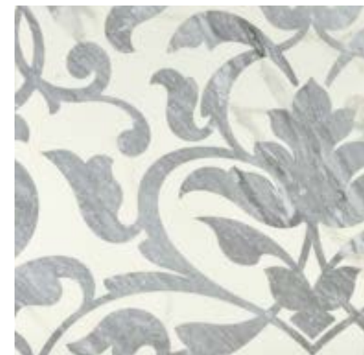
Broccato Calacatta-Bardiglio 60x60 - 24"x24" 6 soggetti assortiti