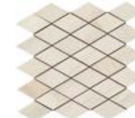
Mosaico Rombi Alabastro Bianco (A)