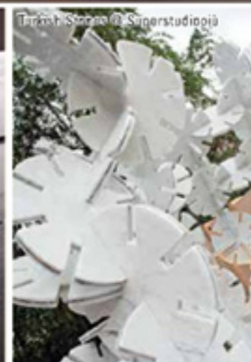
Tortona Store