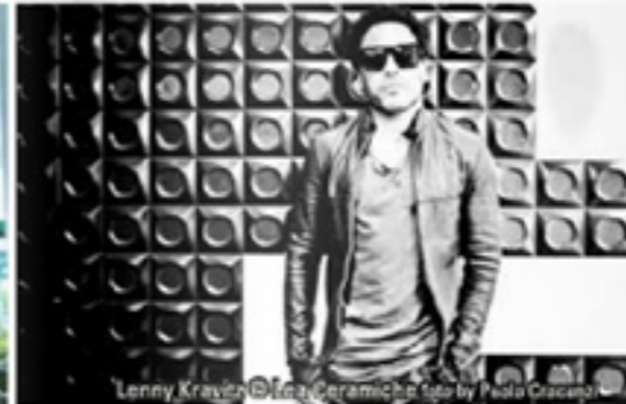
Lenny Kravitz

Ne è stato un esempio "Design Dance", evento-spettacolo in scena presso il Teatro dell'Arte della Triennale di Milano, che ha raccontato l'avventura umana attraverso 456 oggetti di design, classici e moderni, messi in movimento da attori, acrobati, danzatori e meccanismi teatrali. Un'ora e un quarto di divani volanti, tavolini suonanti e lampade danzanti, messi a di-