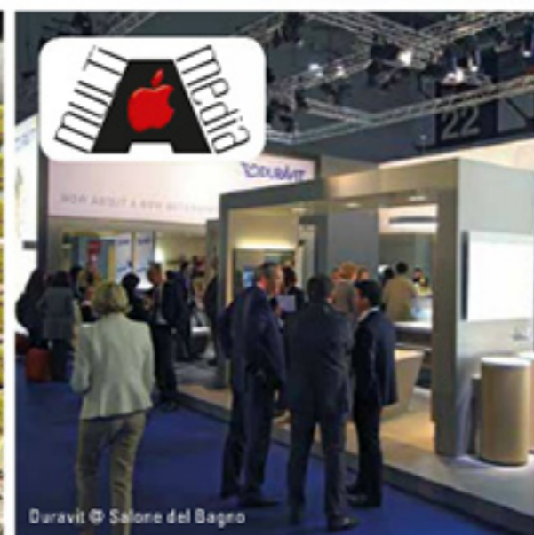
Daravit © Salone del Bagno