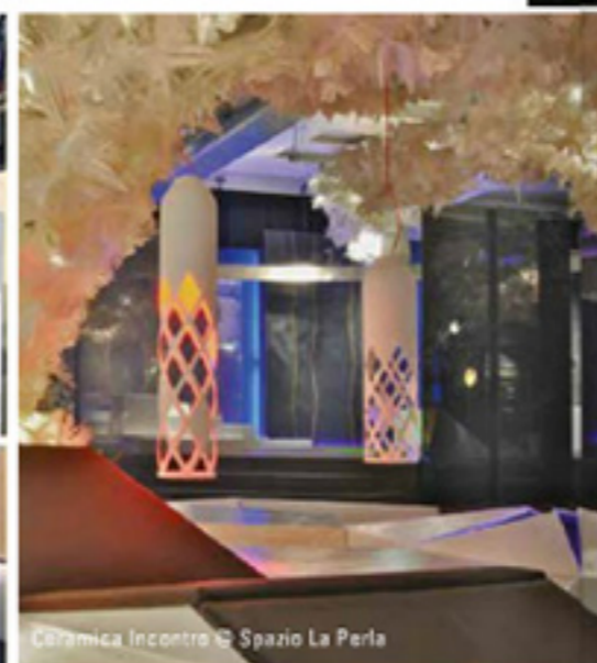
Ceramica Incontro

sposizione da 200 aziende del settore, che hanno registrato ogni sera il tutto esaurito.