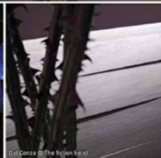
Del Conca